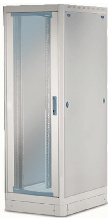
Szafa stojąca RACK 19"

Ze względu na różne miejsca lokalizacji szaf oferowane rozwiązanie musi zapewniać szeroki zakres konfiguracji: drzwi przeszkłone pełne, blaszane pełne lub perforowane 75%, drzwi dwuskrzydłowe przeszkłone, blaszane lub perforowane 75%, osłony boczne blaszane pełne lub perforowane. Szafa musi mieć możliwość zabudowy szeregowej. W celu umożliwienia użytkownikowi montażu urządzeń o zróżnicowanych wymiarach 19" belki montażowe muszą mieć możliwość płynnej regulacji głębokości. Osłony boczne i tylna zdejmowane za pomocą zamków z funkcją ¼ obrotu. Drzwi szafy muszą umożliwiać bezproblemową zmianę strony mocowania. Szafa posiadać będzie 2 przepusty kablowe w płycie górnej i dolnej. Ponadto płyta górna szafy musi umożliwiać montaż panelu wentylacyjnego 4-wentylatorowego z termostatem lub bez, zapewniającego wymianę powietrza w szafie oraz efektywne chłodzenie zainstalowanego osprzętu aktywnego. Stopień szczelności szafy minimum IP 20 zgodnie z normą 60529 EN. Szafa musi być wyposażona cokol o wysokości 100mm.