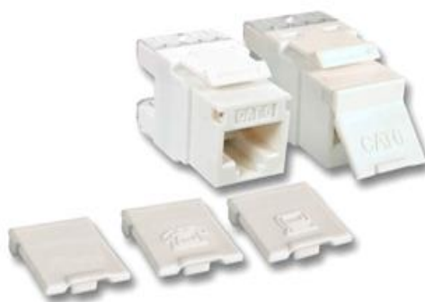
Moduł keystone RJ45 UTP kat.6

Należy użyć modułów zarabianych narzędziowo w celu zapewnienia powtarzalności parametrów połączeniowych. Narzędziowa metoda zarabiania modułów pozwala na dokładne wykonanie połączeń, gwarantując rozsycie kabla na module w sposób całkowicie zgodny z zaleceniem producenta. Wymaga się zastosowania standardowego narzędzia uderzeniowego do złączy IDC typu 110 lub narzędzia do złączy LSA+. Maksymalny rozplot pary transmisyjnej nie może być większy niż 6mm od złącza.